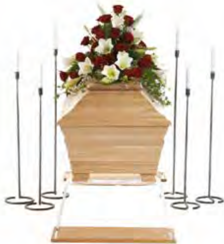
En vacker kistdekoration som enda dekoration från de närmaste.