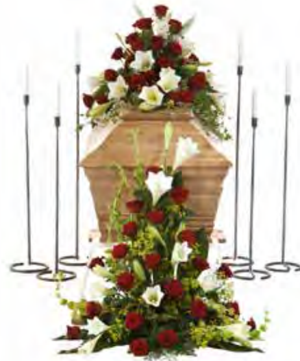
Komplettera med ett arrangemang framför kistan, gärna matchande kistdekorationen.