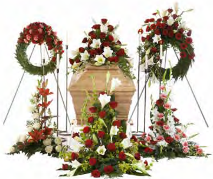
Klassisk uppställning med kransar istället för stående arrangemang.