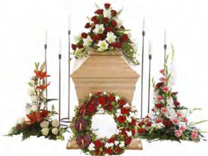
Med större arrangemang får man en fylligare inramning.